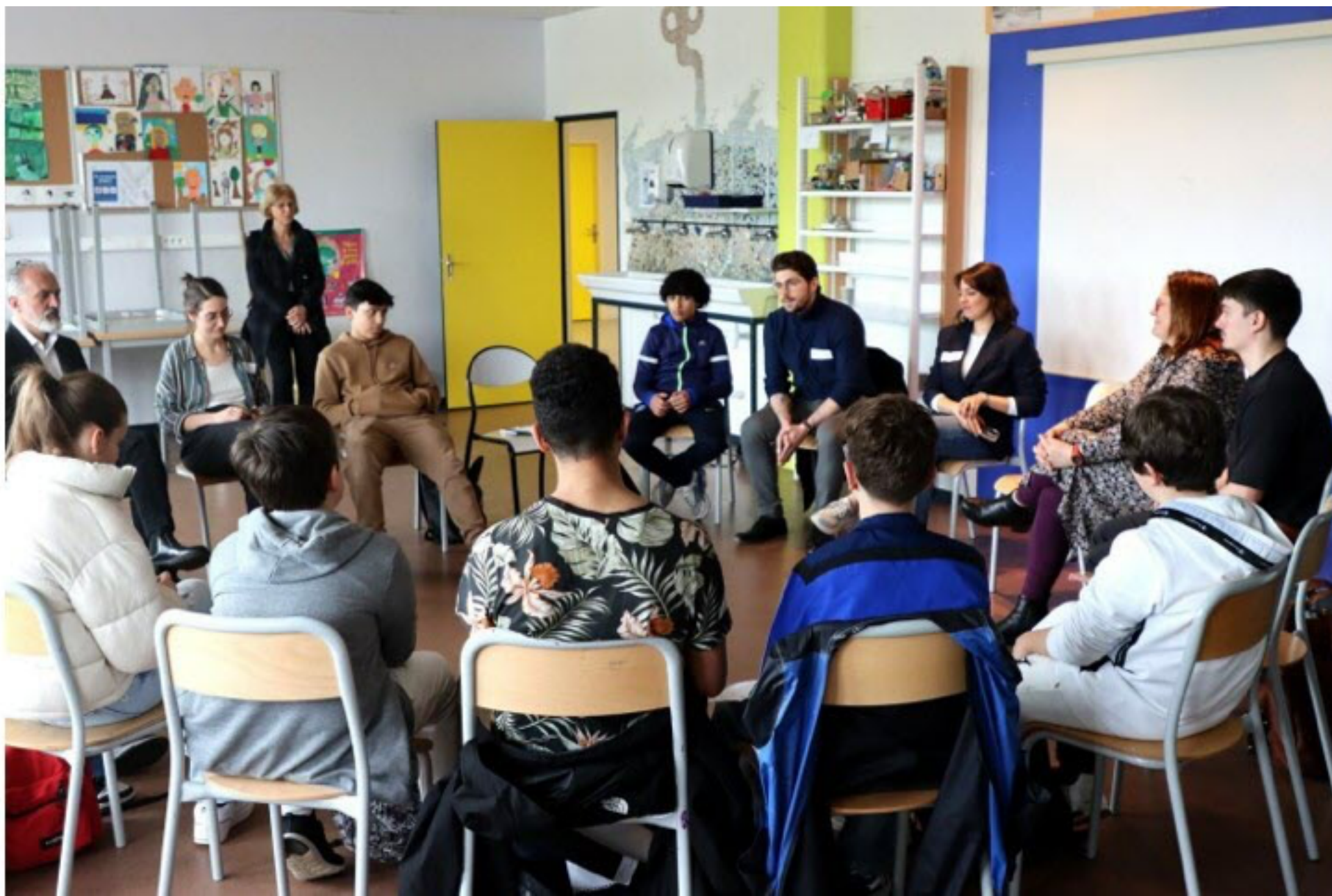
Des jeunes ont participé à l'atelier communication et journalisme avec quatre intervenants professionnels.